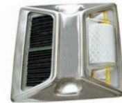
VIALETA SOLAR VRFLX-Z