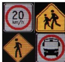
PANTALLA FULL COLOR