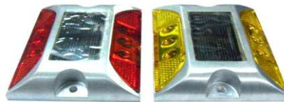
VIALETA SOLAR VI-AL804D