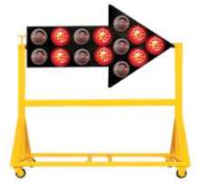
FLECHEROS LUMINOSOS SOLARES Y ELECTRICOS