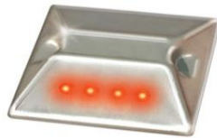
VIALETA ELECTRICA. VIE-ACINO