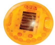
BOTON SOLAR BT-L