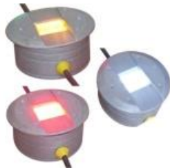
VIALETA MULTIELITE. VI-ME