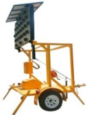
REMOLQUE CON FLECHERO