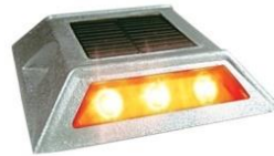
VIALETA SOLAR VI-AL-12