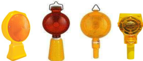
LAMPARAS DE DESTELLO SOLARES Y ELECTRICAS