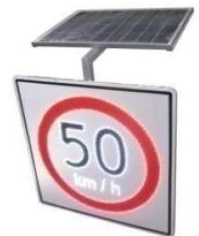
SEÑALES DE LAMINA CON LED