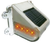
VIALETA PARA BARRERA VI-BA-41