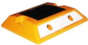
VIALETA SOLAR VI-SOL2C/4C