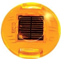
BOTON SOLAR BT-1300