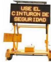
REMOLQUE CON TABLERO