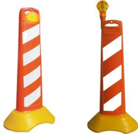
BARRICADAS CON LUZ