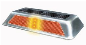
SUPER TOPE TP-45-SOLAR