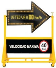
FLECHERO CON RADAR